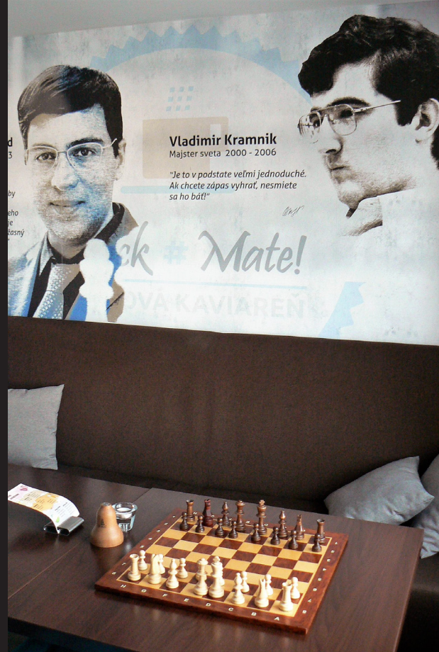
Interiér kaviarne Check # Mate