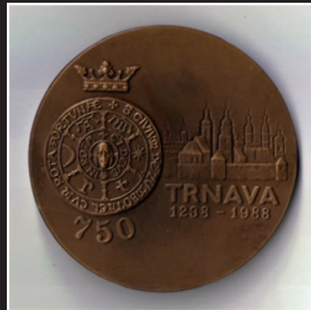
Pamätná medaila Trnavia 1988