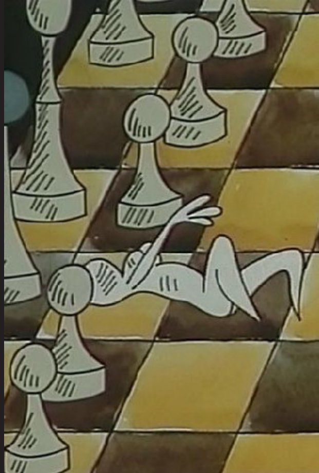
Šach – záber z filmu (Viktor Kubal)