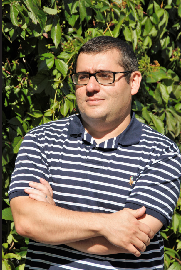
GM Sergej Movsesian (*1978) šachový profesionál

keďže tento Armén narodený v Gruzínsku, žijúci v Prahe, ovládajúci deväť jazykov, nezískal české, ale slovenské občianstvo; ako náš jediný občan má titul majstra Európy, a to v bleskovom šachu z roku 2002 a po prestupe do arménskej federácie aj zlatú medailu z majstrovstiev sveta družstiev 2011 a olympiády 2012